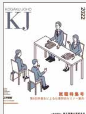
卒業生による仕事研究セミナー 工学情報特集号