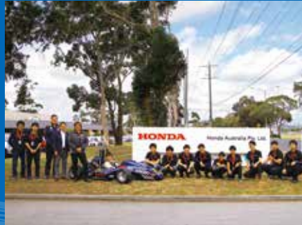
フォーミュラSAEプロジェクト