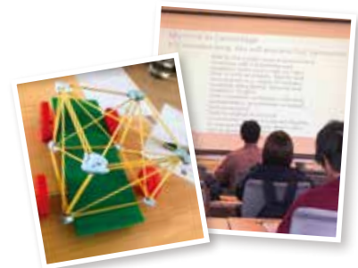
ある一日の時間割

●新型コロナウイルス感染状況により海外渡航ができない場合、以下のオンラインプログラムの実施を予定しております。