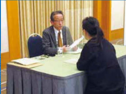
父母懇談会の様子