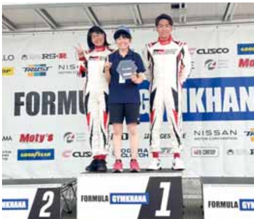
Formula Gymkhana 2024女子クラス表彰式

1つ目は「本庄軽one耐久シリーズ2024N-Nクラスシリーズ」です。これは本庄サーキットで行われている軽自動車で行われる耐久レースです。ルールで定められた範囲で軽自動車を改造し、その車を複数のドライバーが乗り継いで5時間という長い時間を走り抜きます。私たちは4年間このレースに参加し、レース毎に車の改良、レース戦略の研究、練習合宿を重ねてきました。そして遂に、学耐クラスで優勝することができました。