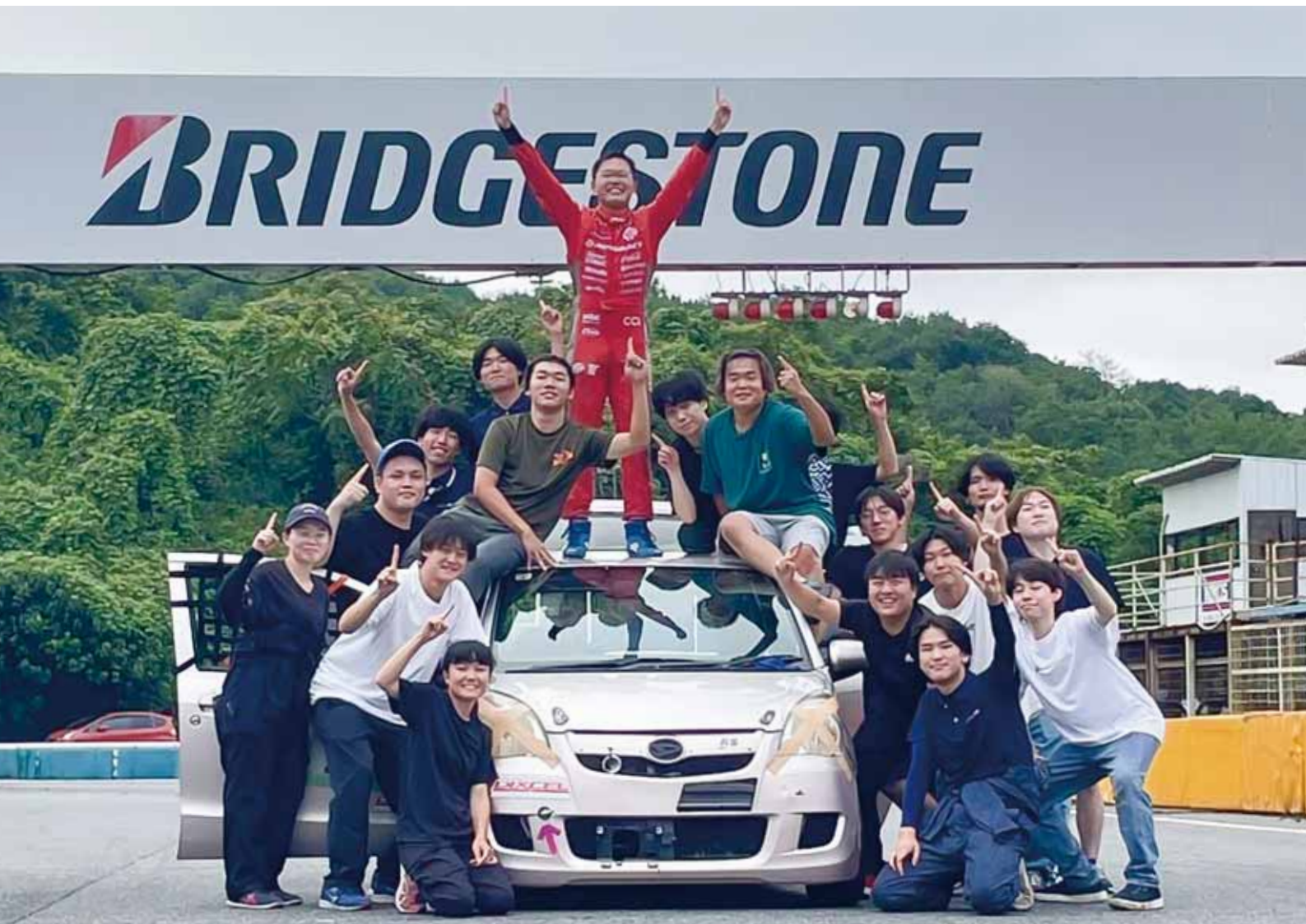
東京千住キャンパス自動車部「本庄軽one耐久シリーズ2024N-Nクラスシリーズ」優勝