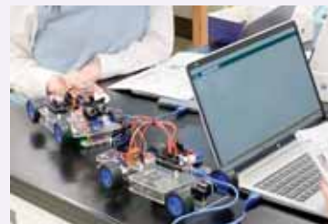
鷗友学園女子中学高等学校

過年度の連携事例を含め、より詳細な情報は以下の中高大連携のwebページをご覧ください。 https://www.dendai.ac.jp/about/chukodai/