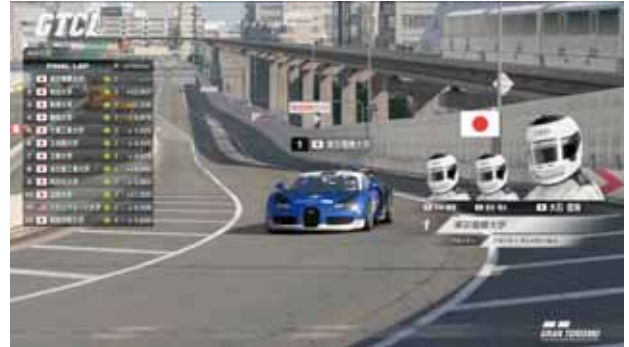
GTカレッジリーグ大会の様子(配信画面)

男子クラスと女子クラスがあり、それぞれに参加しました。男子クラスは惜しくも全国大会進出とはなりませんでした。女子クラスは東日本大会を1位で通過し、全国大会へ進出しました。