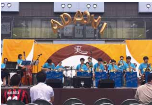
足立学園のステージ

嬉しいことに、今回のような地域の演奏会や学園祭に足を運んでくださる方々が年々増えてきています。このような活動ができるのも、主催者の方々をはじめ、大学関係者、また演奏を聴いてくださった方々のおかげです。この場を借りて感謝申し上げます。新たなコーストジャズオーケストラのファンを増やすために、今後も私たちが披露できる最高のステージを研究していこうと思います。これからも応援をよろしく願います。