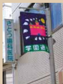
現在は千寿常東小学校の生徒さんがデザインしたフラッグが飾られている

デザインは、3カ月周期で一新し、それぞれ学校の特徴や季節に応じたものとなっています。商店街にお越しの際は、是非ご覧ください。