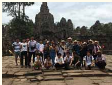
アンコールワットで記念撮影