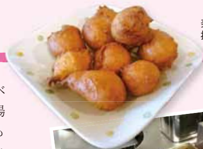
美味しく出来た揚げドーナツ