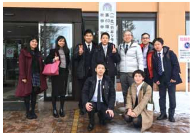
2017年11月に酪農学園大学北海道江別市)で開催された、第63回リモートセンシング学会にて

その成果を年数回、国内・国外の学会で発表しています。地震災害・森林減少箇所をいかに早く正確に捉えるかが課題です。