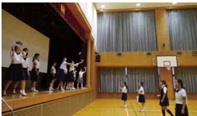
舞台から飛翔体を飛ばす生徒たち