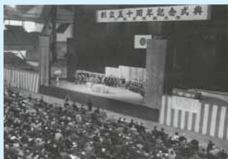
東京都体育館で挙(昭32)された創立50周年記念式典

修士課程を設置(昭33)、さらに工学部第一部、同第二部に学科増設を行い、また校舎は本館及び4号館の増改築、5号館・6号館の新築を行った。