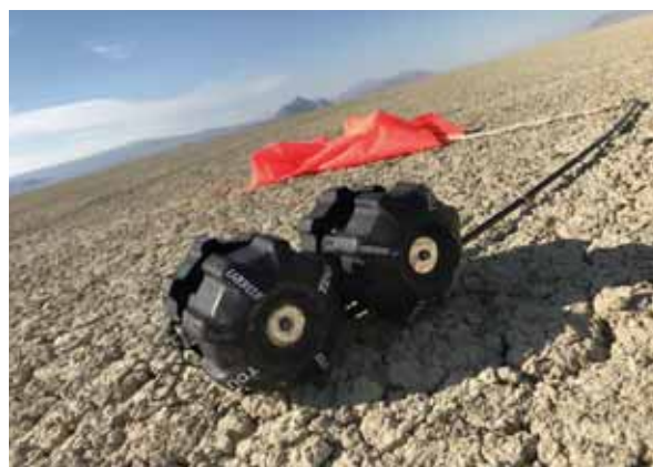
高度4,000mから着地直後の機体

今後は取得したデータを生かして開発・改良を行い、優勝するために邁進していく所存です。今後の活動にご期待ください。