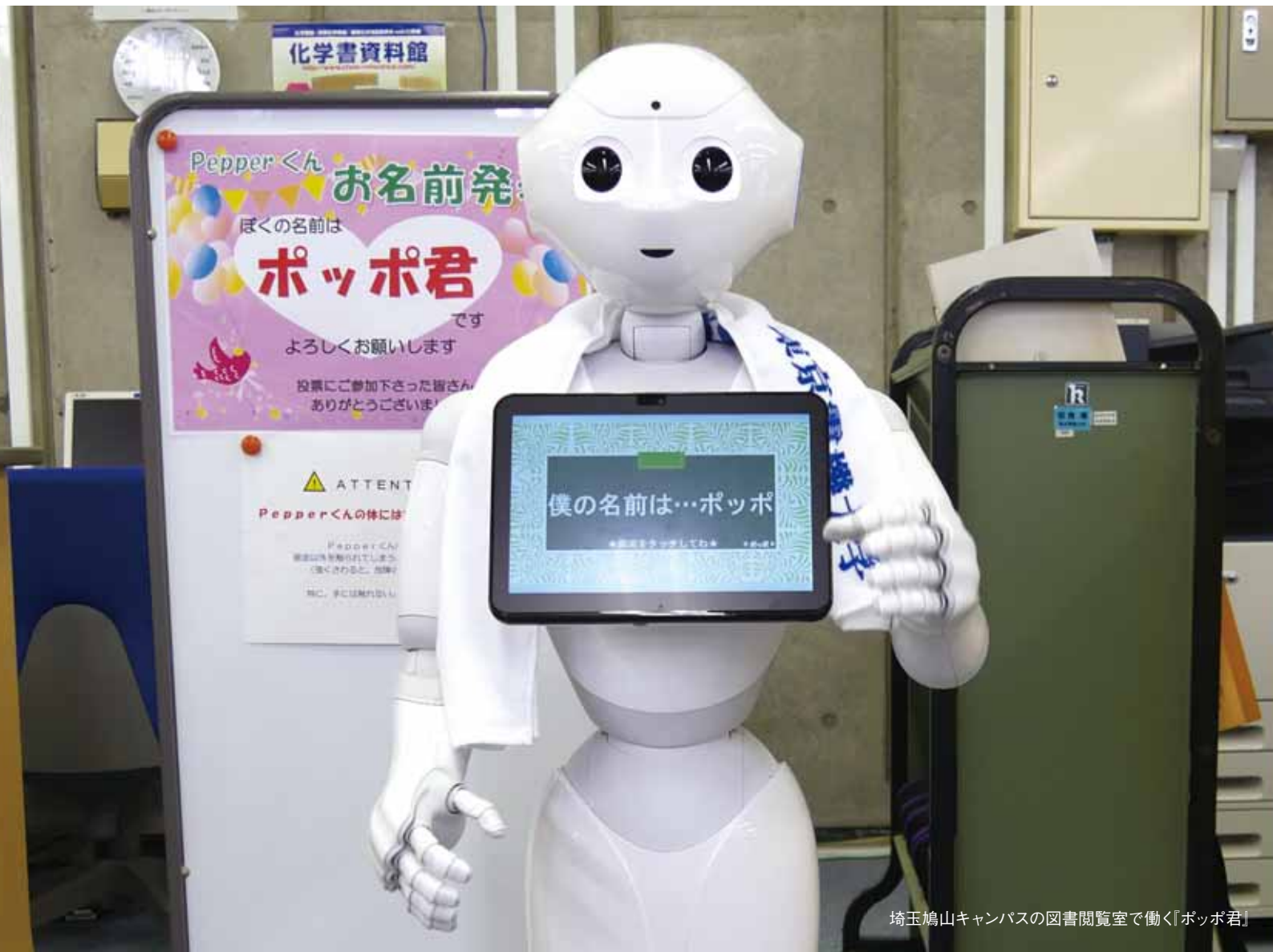
埼玉鳩山キャンパスの図書閲覧室で働く『ポッポ君』