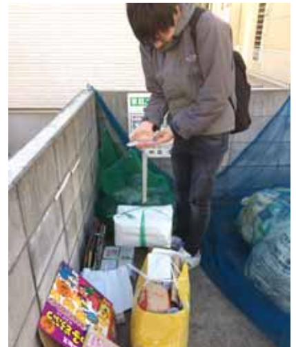
リサイクルに出された資源物の計量調査

他にも大学院生が取り組んでいるテーマに、VR(バーチャルリアリティ)で空間の大きさや広がりなどをどのように知覚しているかの研究や、ベビーカーを利用して外出する際の不便や制約に関する研究があります。このように、生活環境の様々な面からデザインの役割・可能性について考えています。