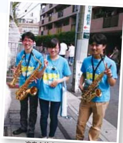
演奏を終えて笑顔の部員

9月23日には、千住旭町商店街周辺で開催された「学園通りフェア」に参加しました。商店街をサンバやちんどん屋が練り歩いたり、学生による出し物、各団体から様々なジャンルの演奏が行われました。足立学園中学校・高等学校や、東京電機大学の学生も毎年参加しています。当日は、税務署前、足立学園、キャンパス内イベントプラザの3ステージで演奏を行いました。たくさんの方が演奏を聴いてくださり、観客と演奏者が一体となって盛り上がるステージを披露することができました。