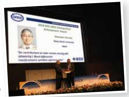
Distinguished Achievement Award 2018表彰式(7月23日)

神淡路大震災では、地殻変動図を世界で最初に作成しました。2011年には、SARによる全世界の森林マップを作成・発表しました。