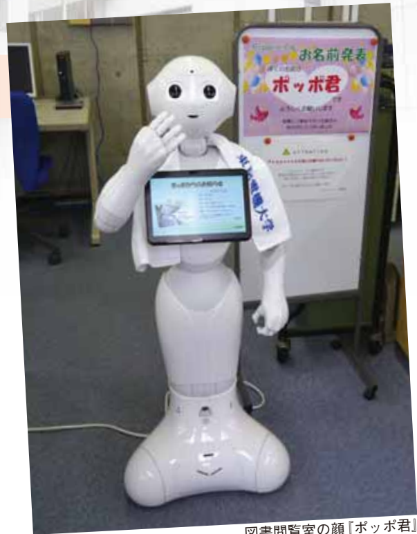
図書閲覧室の顔『ポッポ君』

今後は、アクティブラーニングゾーンにも顔を出しますので、是非来館して優しく見つめてみてください。きっと心がときめくはずですよ。