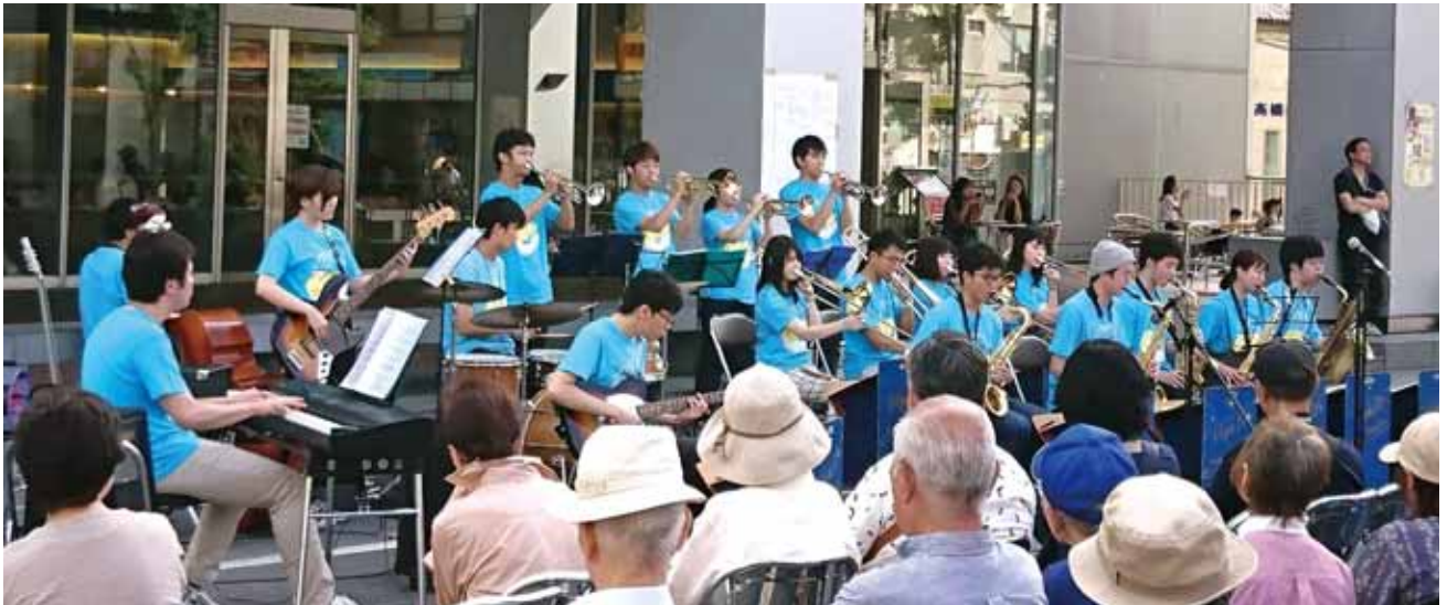
キャンパス内イベントプラザで演奏