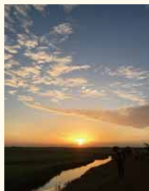
村から眺める朝日