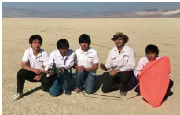
会場のブラックロック砂漠