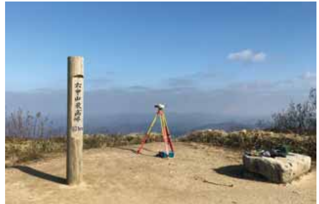
六甲山最高峰でのGPS観測