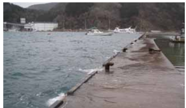
東日本大震災で沈降した女川港の岸壁(2012年3月10日撮影)

近代的な科学が日本に入ってきてから150年が経過し、この間多くの成果が挙げられました。しかし、地球の営みに比べればほんのわずかの時間にすぎません。実は「定説」とされるものの多くは、小さな成功体験をもって、全てわかったと思い込んだ結果です。若い皆さんには、常に「定説」を疑いその根拠を考えることを勧めます。多くは科学的な根拠がないものかもしれませんが。それらを捨て去り、新しい概念を打ち立てることで、科学は進歩してきました。皆さんがこの活動の次の担い手となることを期待しています。