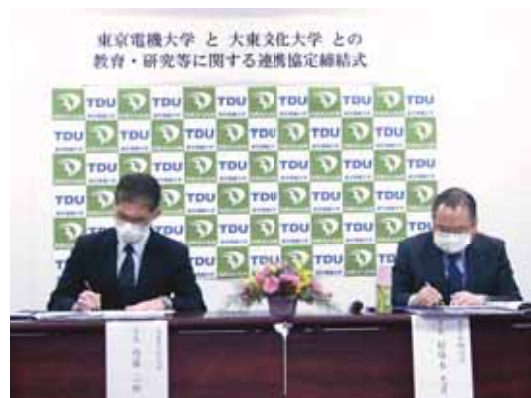
東京電機大学 と 大東文化大学 との 教育・研究等に関する連携協定締結式

これまで埼玉東上地域大学教育プラットフォーム（TJUP）の会員校として連携してきましたが、本協定締結を契機に、共同研究を始めとして、両大学の学生や教職員の交流機会を増やし、従来以上の連携体制を構築し更なる発展に繋げていきます。