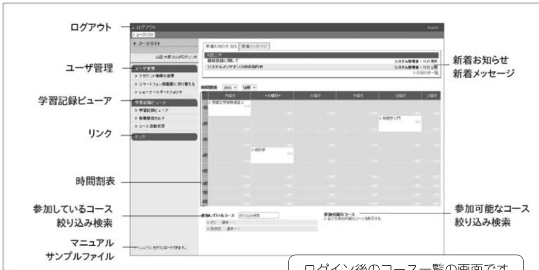
ログイン後のコース一覧の画面です