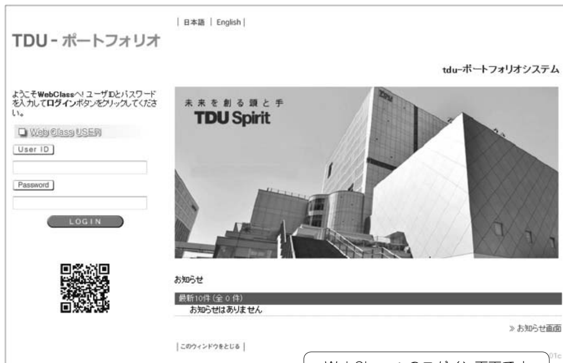
WebClass へのログイン画面です

ログイン画面で、大学共通認証のユーザ ID とパスワード入力して「LOGIN」ボタンをクリックします。WebClass へのログインに成功すると、このユーザが所属しているコース一覧と新着情報が表示されます。WebClass のコースとは、授業科目のことです。履修登録してある科目がカレンダーの形式で表示されます。科目名をクリックすることで、コース内へ移動し、「コースメニュー画面」が表示されます。画面左側に「機能メニュー」、画面右側に「コンテンツ一覧」が表示されます。