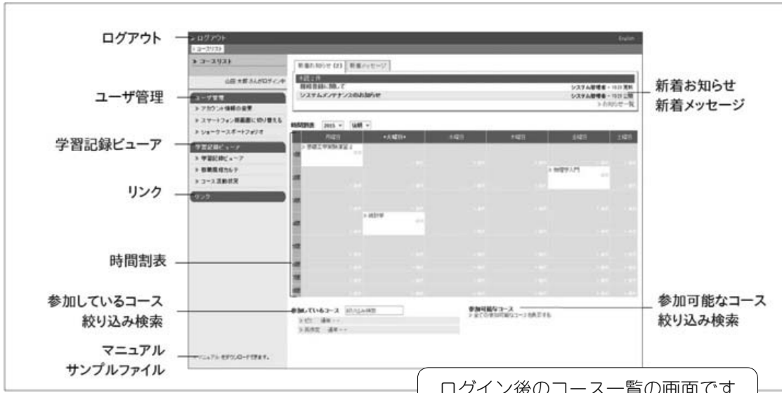
ログイン後のコース一覧の画面です