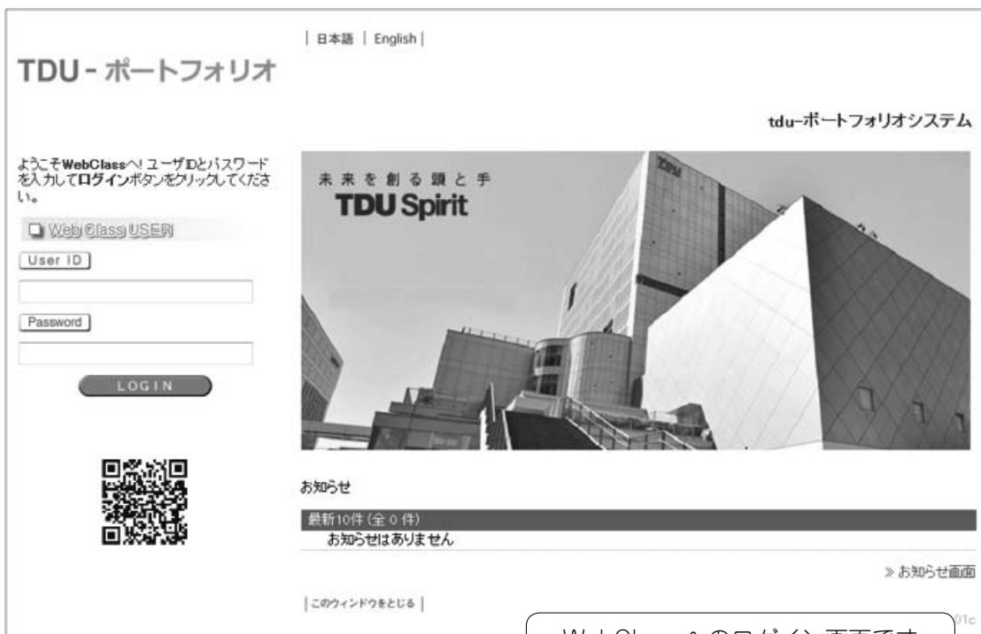
WebClass へのログイン画面です

ログイン画面で、大学共通認証のユーザ ID とパスワード入力して「LOGIN」ボタンをクリックします。WebClass へのログインに成功すると、このユーザが所属しているコース一覧と新着情報が表示されます。WebClass のコースとは、授業科目のことです。履修登録してある科目がカレンダーの形式で表示されます。科目名をクリックすることで、コース内へ移動し、「コースメニュー画面」が表示されます。画面左側に「機能メニュー」、画面右側に「コンテンツ一覧」が表示されます。