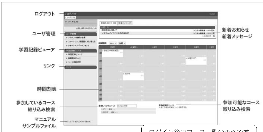
ログイン後のコース一覧の画面です