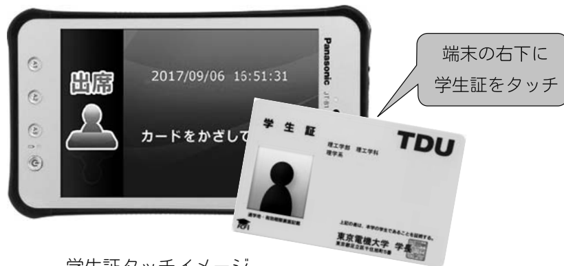
学生証タッチイメージ

授業の出席確認は、授業教室においてタブレット端末に、学生証をタッチして行います。担当教員の出席確認の指示に従って行ってください。授業によっては、遅刻・早退等の確認をするため、複数回の出席を取る場合もあります。タブレット端末にて出席確認を行った場合は、DENDAI－UNIPAで確認することができます。また、出席確認の方法は、授業によってはタブレット端末によらない場合もありますので、教員の指示に従ってください。学生証を忘れた場合は、授業時に担当教員に申し出てください。