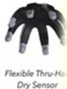
Flexible Thru-Hole Dry Sensor