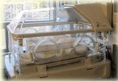
A Need in NICU