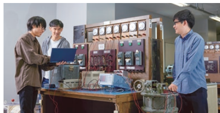
※イメージ写真です。実際の展示内容とは異なります。

学科説明会 2 9階 2903教室 ①11:15~11:35 ②12:15~12:35 ③14:15~14:35