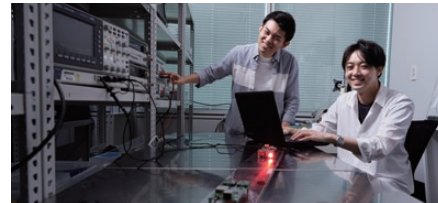
※イメージ写真です。実際の展示内容とは異なります。

学科説明会 2 6階 2604教室 ①12:15~12:35 ②13:15~13:35 ③14:15~14:35