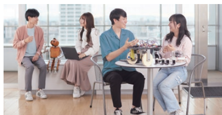
※イメージ写真です。実際の展示内容とは異なります。

学科説明会 2 10階 21001教室 ①11:15~11:35 ②12:15~12:35 ③13:15~13:35