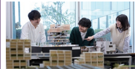
※イメージ写真です。実際の展示内容とは異なります。

学科説明会 2 7階 2703/2704教室 ※2704へは中継 ①11:15~11:35 ②13:15~13:35 ③14:15~14:35