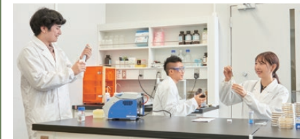
※イメージ写真です。実際の展示内容とは異なります。

学科説明会 2 10階 21005教室 ①11:15~11:35 ②13:15~13:35 ③14:15~14:35