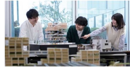
※イメージ写真です。実際の展示内容とは異なります。