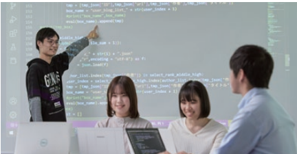
※イメージ写真です。実際の展示内容とは異なります。