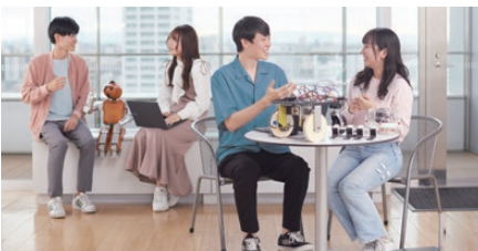
※イメージ写真です。実際の展示内容とは異なります。