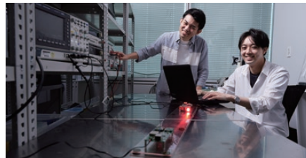
※イメージ写真です。実際の展示内容とは異なります。