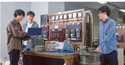
※イメージ写真です。実際の展示内容とは異なります。