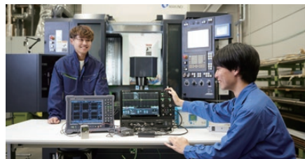
※イメージ写真です。実際の展示内容とは異なります。