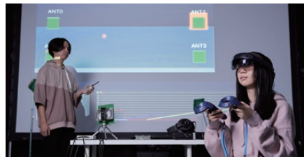
※イメージ写真です。実際の展示内容とは異なります。