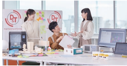
※イメージ写真です。実際の展示内容とは異なります。