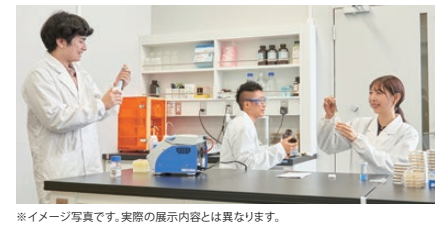
※イメージ写真です。実際の展示内容とは異なります。