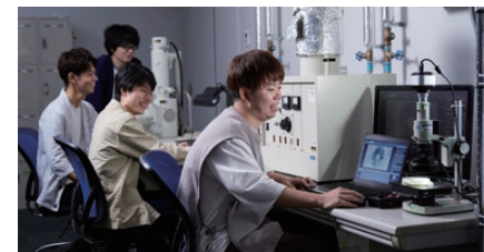
※イメージ写真です。実際の展示内容とは異なります。