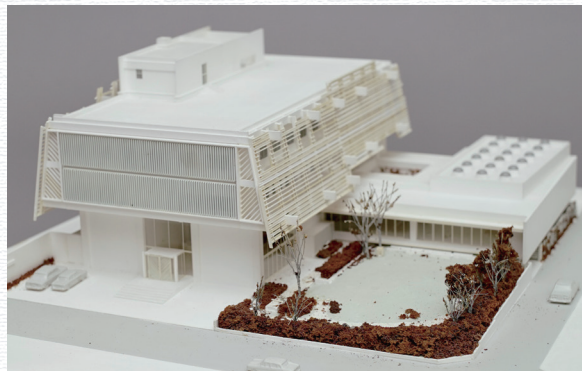
芦原義信 「杉並会館」 (S=1/150)