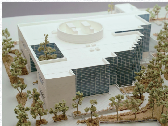
黒川紀章 「中央図書館」 (S=1/200)