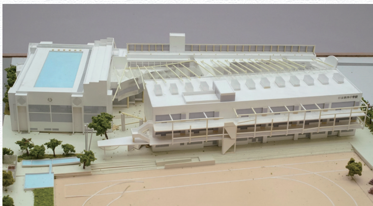
船越徹「杉並第四小学校」(S=1/200)